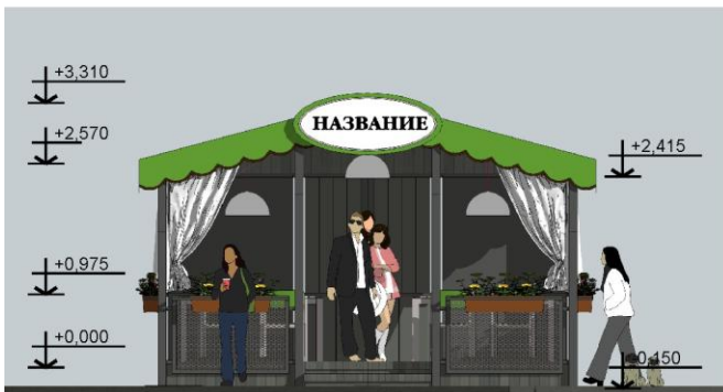
Фасад в осях Г-А