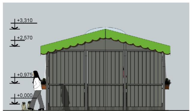
Фасад в осях А-Г