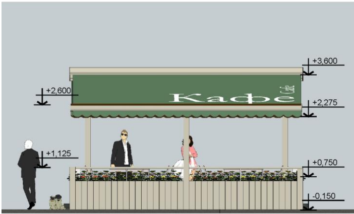
Фасад в осях 1-5