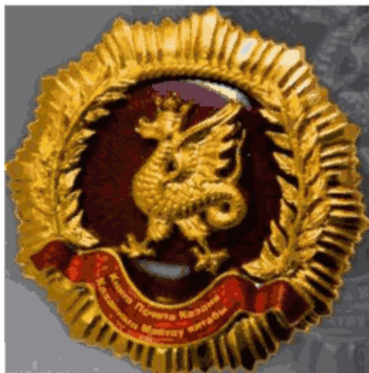
"Нагрудный знак, памятный знак (размеры 30 мм и 90 мм в диаметре)"