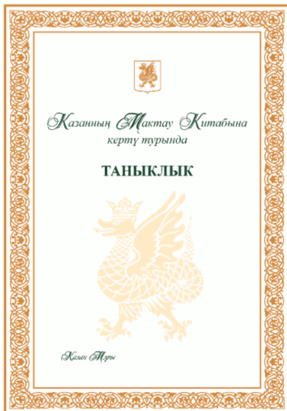
"Свидетельство о занесении в Книгу Почета (форматы А4 и А3)"